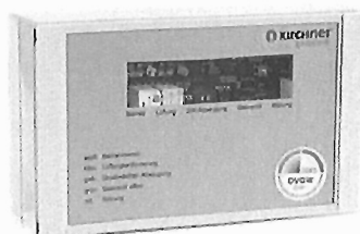
KÜCHENSTEUERUNG KCU 100ADW