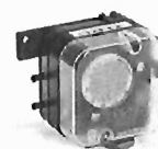
LUFT-DRUCKWÄCHTER (ZU- UND ABLUFT) DW 500 / VL 500